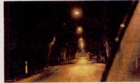
El proyecto contempla el perfilado de los 15 túneles que hay en la vía, así como el cambio de su iluminación y la canalización de sus aguas.