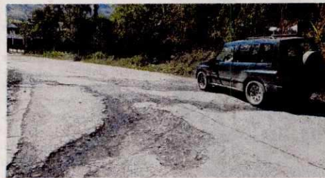
En algunos puntos se hará la ampliación de curvas. También se construirán andenes y paraderos en los pasos urbanos de los pueblos.